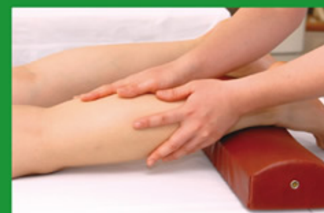
あん摩マッサージ指圧師

艾(もぐさ)を燃焼させ、ツボ(経穴)に温熱刺激を与え、それによって起こる効果的な反応を利用して疾病の予防または治療を行います。