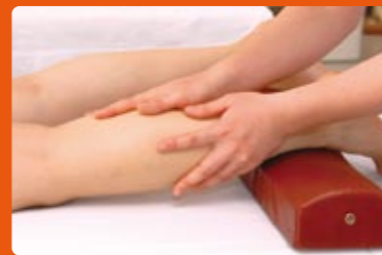
あん摩マッサージ指圧師

艾(もぐさ)を燃焼させ、ツボ(経穴)に温熱刺激を与え、それによって起こる効果的な反応を利用して疾病の予防または治療を行います。